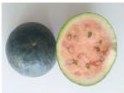
Формы арбуза столового с различным количеством семян

мякоти плодов, а также над их вкусовыми качествами.