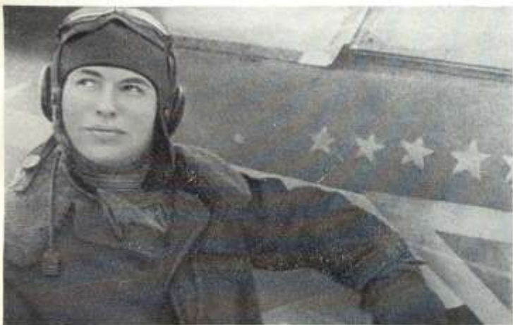
После возвращения с боевого задания: лейтенант Николай Скоморохов у своего самолета.