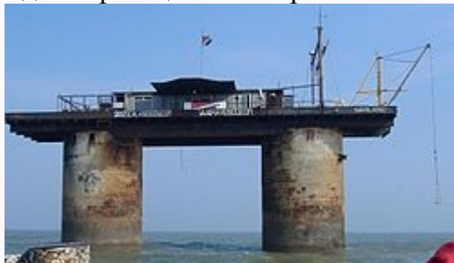
Силенд после пожара

30 сентября 1987 года Великобритания объявила о расширении своих территориальных вод с 3 до 12 морских миль. На следующий день аналогичное заявление сделал Силенд. Реакции со стороны британского правительства на расширение территориальных вод Силенда не было. С точки зрения международного права это означает, что морская зона между двумя странами должна делиться поровну. Этот факт рассматривается сторонниками независимости Силенда как факт его признания. Хотя отсутствие двустороннего соглашения, регулирующего этот вопрос, стало причиной опасных инцидентов. Так, в 1990 году Силенд обстрелял предупредительными залпами британское судно, несанкционированно подошедшее к его границе.