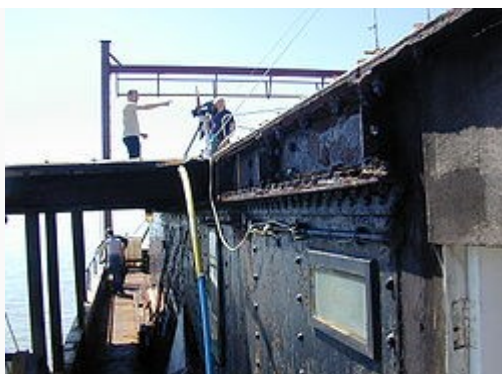
Съёмки документального фильма на платформе